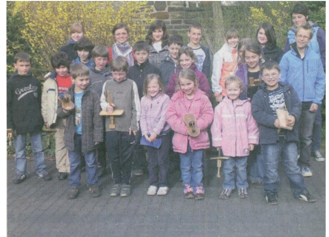
26 Kinder zogen durch die Straßen von Hönnigen und verkündeten die Tageszeit, während die Glocken „nach Rom geflogen waren“.

Alter Brauch wird hochgehalten – seit 1979 sammelt man dabei für den guten Zweck